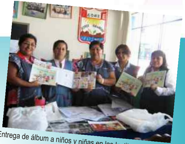
Entrega de álbum a niños y niñas en las Instituciones Educativas.