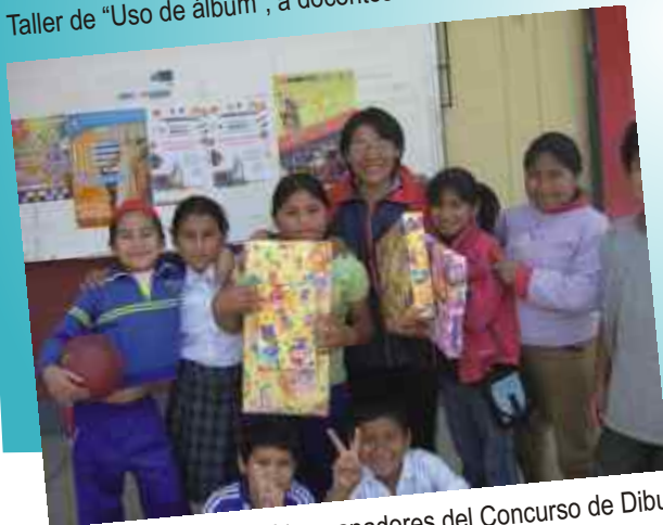
Premiación a niños y niñas ganadores del Concurso de Dibujo de Pintura, en la IE 7224 Elías Aguirre.