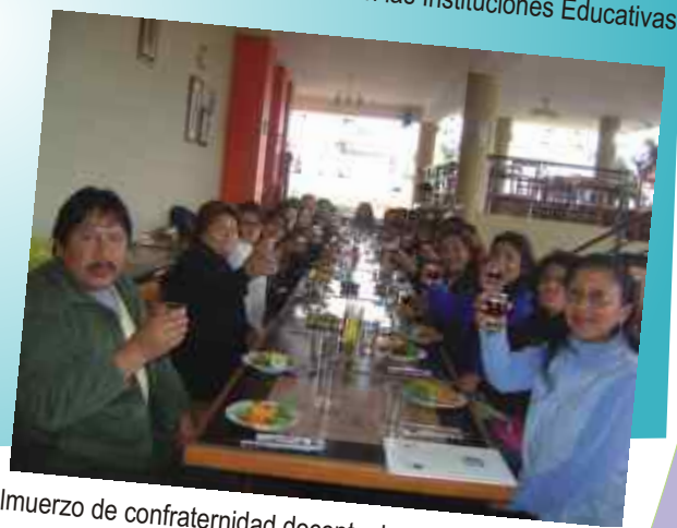
Almuerzo de confraternidad docente, luego del taller de "Educación Inclusiva", por celebración del Día del Maestro.