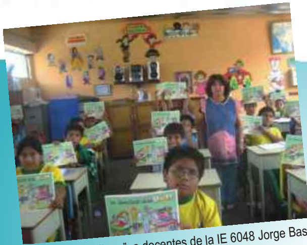
Taller de "Uso de álbum", a docentes de la IE 6048 Jorge Basadre.